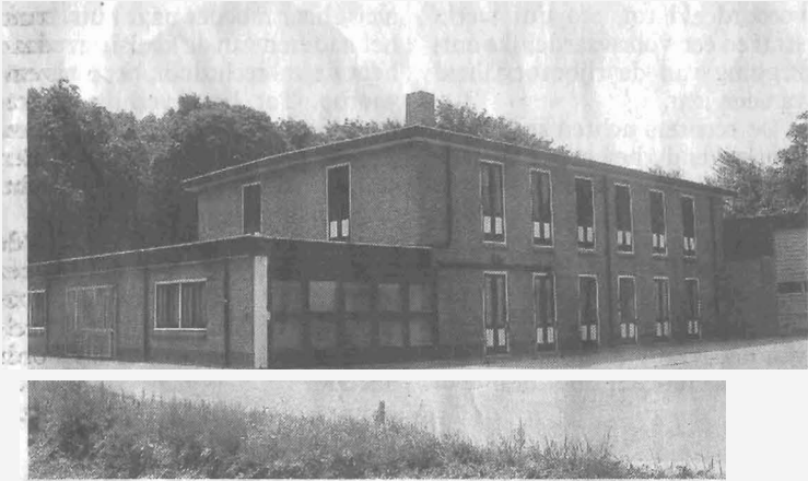
Het mooiste voorbeeld van een hergebruikte bollenschuur.

nen zien dat het oorspronkelijk gebruikt werd voor de bloembollenteelt. Drie voorbeelden.