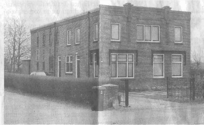
Ooit woonhuis en bollenschuur ineen.